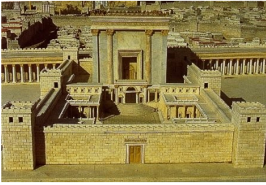
Le temple de Jérusalem