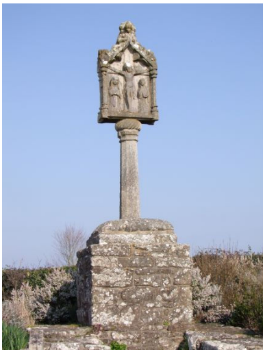
Séné – Calvaire de Montsarrac Croix-lanterne typique du 56