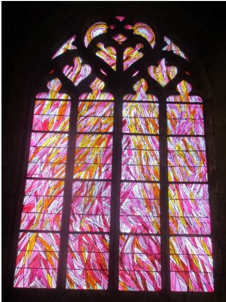
Vitrail de la Résurrection La Madeleine – Penmarc'h