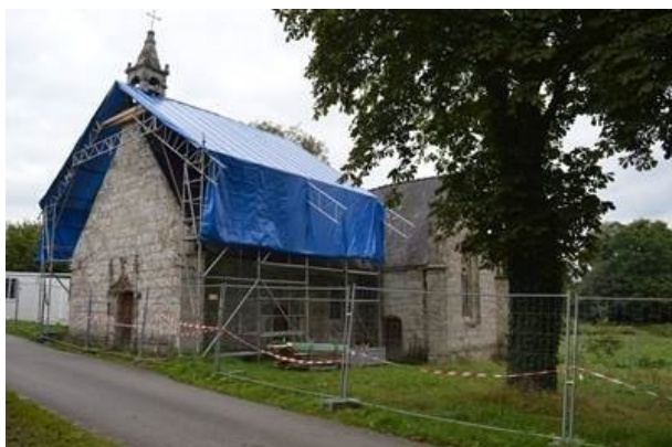
Mise en place du parapluie et de la clôture du chantier

Dans le dernier KBS ( 13 novembre 2021 ) nous vous donnions des nouvelles des travaux démarrés au mois de juin. Voici quelques photos du chantier :