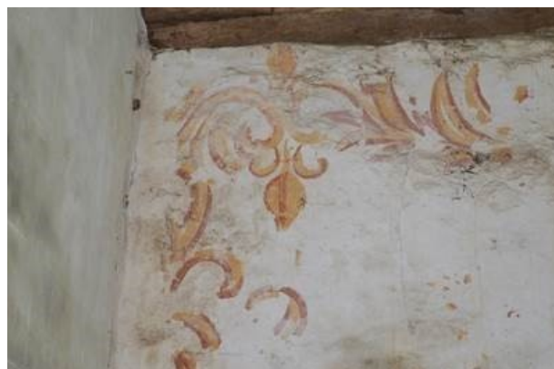
Restes des peintures murales avec motifs floraux découverts sous les lambris du transept.