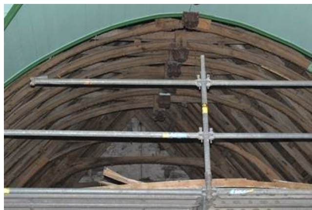
Vues de l'ancienne charpente