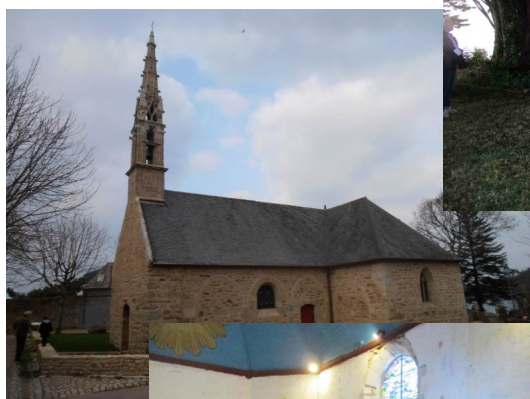
Pardon Juin 2022