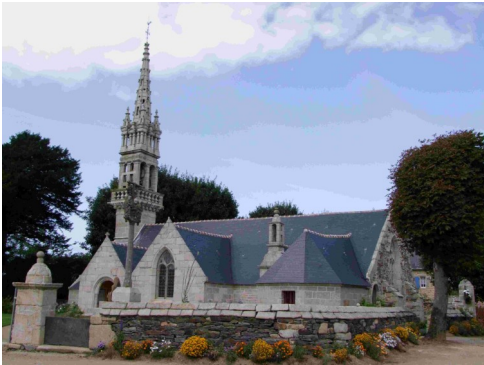
Eglise de Ploéven

Son nom et ses lieux de culte : Ewen en breton. Le fait que les toponymes « Even » soient autant dispersés dans l'espace, pourrait faire penser à deux, voire plusieurs saints du même nom. Il est le saint éponyme de Ploeven ( 29 ) et le patron de la Malhoure, sous le nom Event ( 22 ). Il était titulaire d'une chapelle à Kerlaz.