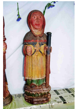
Bannière et statue de st Even Kerlaz

Sa vie : pour le chanoine Garaby, Even serait né en Armorique au Ve siècle, de Guindaf l'ancien fils d'Emyr, prince du pays. Neveu de saint Germain, il l'accompagna dans les îles et sous la conduite de l'abbé Cadvan, aida son oncle dans sa tâche. Even se distingua tellement qu'il fut appelé à gouverner l'abbaye d'Enli à la mort de Cadvan. Ces deux saints ( Germain et Even ) sont liés à Kerlaz : l'un étant patron de l'église et l'autre titulaire d'une chapelle ( détruite ).